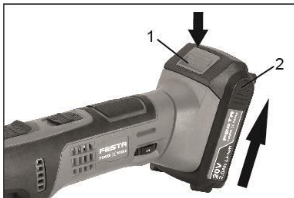
1. Tlačítko 2. Baterie