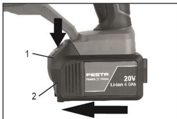
1. Tlačítko 2. Baterie